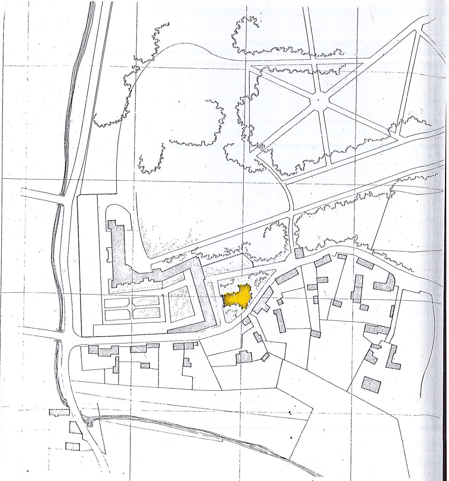
PLANE SITUATION 1/25.000 eme.